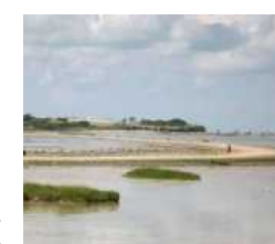
Les horaires des marées à la Passe aux Bœufs n'étaient pas exacts, ce mardi 13 avril.

Une petite coquille dans les horaires de marée, et tout peut partir en mésaventure. C'est ce qui est arrivé, mardi 13 avril en fin d'après-midi, à douze promeneurs venus prendre l'air sur l'île Madame, dans la commune de Port-des-Barques. Passé 16 heures, le groupe s'est retrouvé à sa grande surprise encerclé par la mer et donc coincé sur l'îlot. Encore des touristes qui méconnaissent les lois des marées ? Non, il s'agissait de locaux qui étaient bien dans leurs 10 kilomètres autorisés. Mais la faute aux horaires affichés sur le panneau d'information à l'entrée de la passe aux Bœufs, qui relie Port-des-Barques à l'île Madame. La petite commune rochefortaise venait de modifier sa grille ho-