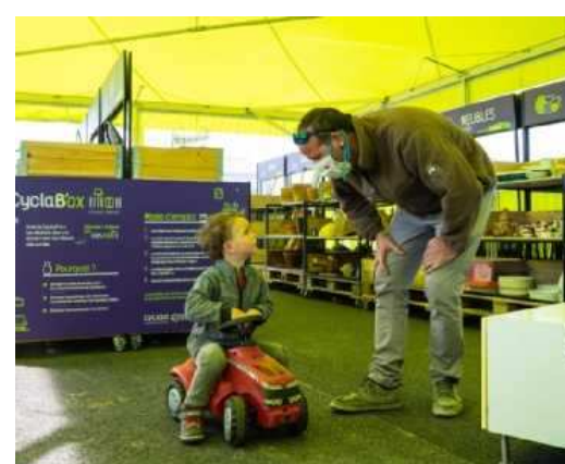
Ce petit garçon est venu à la déchetterie avec son papa. Il est reparti sur son joli tracteur, trouvé gratis à la Cyclab'box.

Grâce à un tri le plus poussé possible, le poids de la poubelle de Cyclad est tombé à 169 kilos par an et par habitant. Il était de 190 kilos en 2015 et pourrait encore baisser.