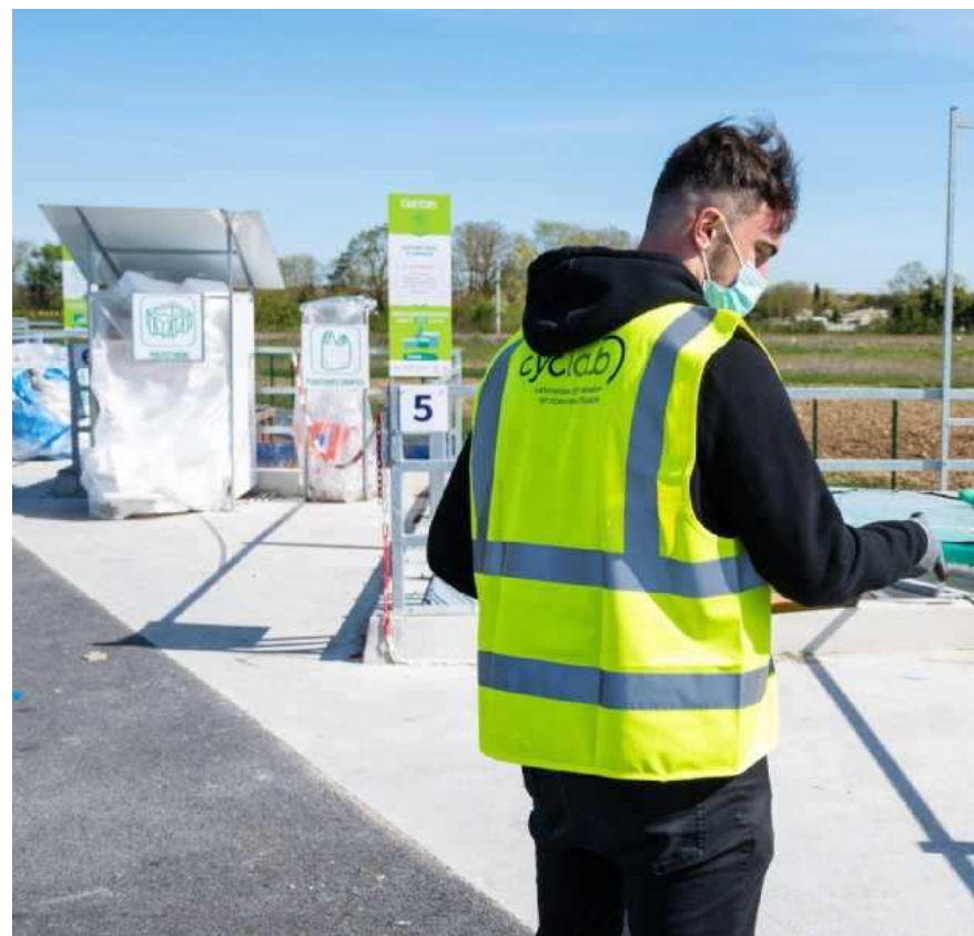
Chez Cyclad, tout ce qui peut être détourné de la benne de déchetterie, l'est pour resservir ailleurs, parfois sous une autre forme. XAVIER LEOTY