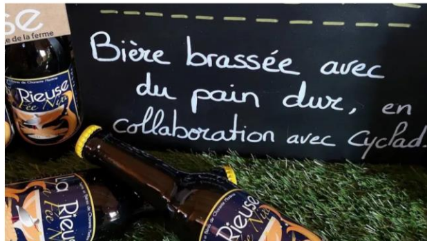
A l'image de la bière "fée Nixe", tous les produits sont faits avec des aliments ou outils réutilisés - Cyclad

Une filière de produits 100% Charente-Maritime a été lancée ce lundi 18 mars à l'office du tourisme de Surgères. Le principe : utiliser ce qui va être jeté pour créer des aliments ou des objets.